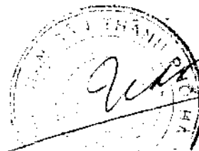
Nguyễn Quốc Triệu